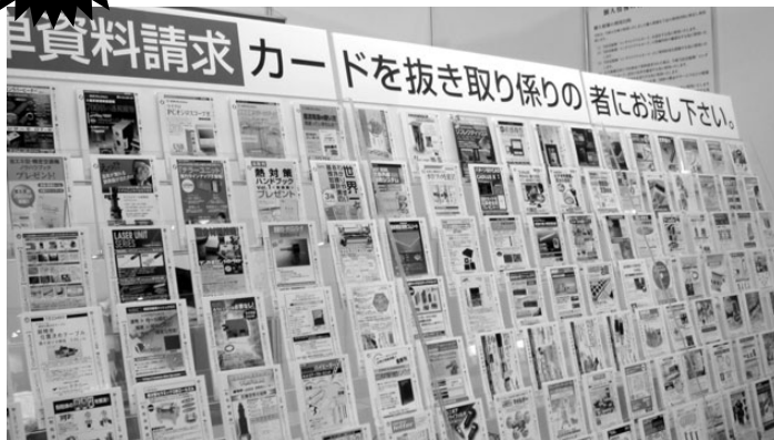
▲写真は2009年1月ネブコンワールドジャパン