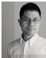
猪熊 純 (建築家) 成瀬・猪熊建築設計事務所